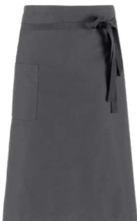
M12 Grigio medio