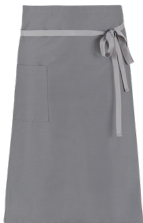
C02 Grigio chiaro