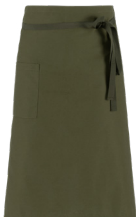
Z43 Verde militare