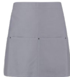
019 Light Grey