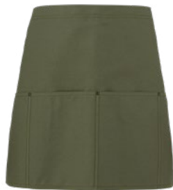
102 Military green