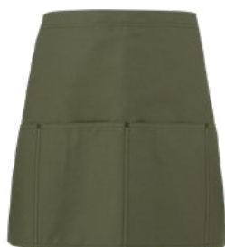
102 Verde militare