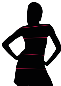
TABLE ST-K1 SLIM FIT