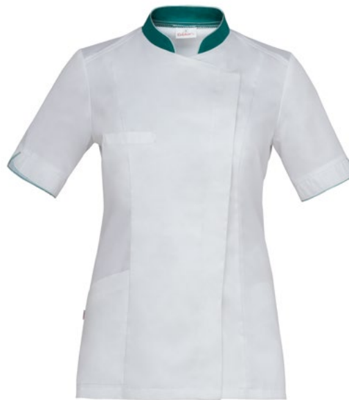
0-002 Bianco Verde