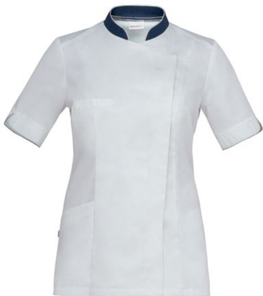
0-004 Bianco Blu