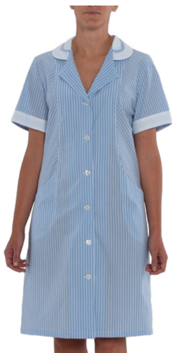
R118 Light blue