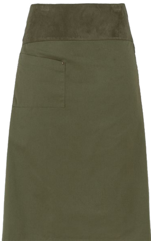
102 Verde militare