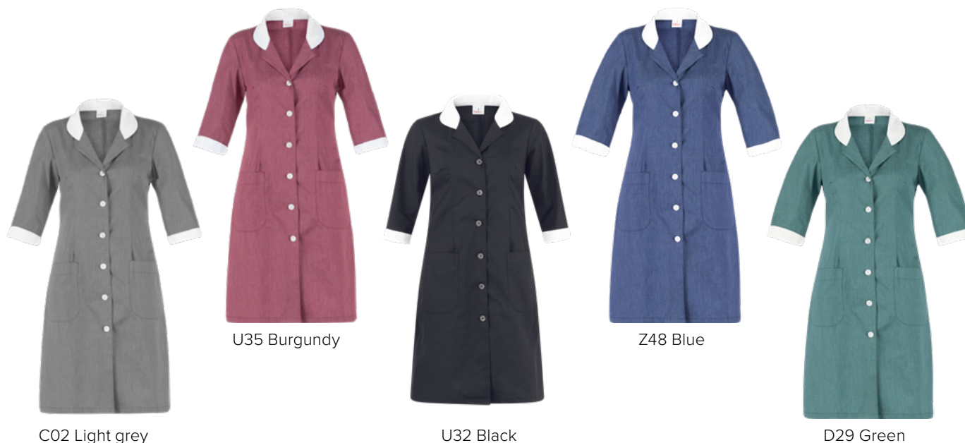
C02 Light grey