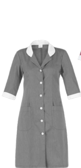
C02 Grigio chiaro